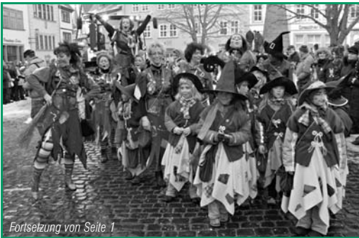
Fortsetzung von Seite 1