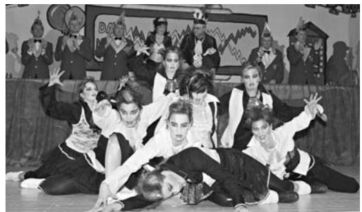
Das Show-Ballett des MCC - hier als Vampire.