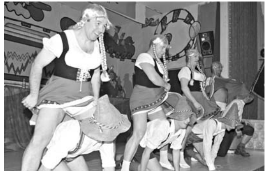
Die Tanzbären des MCC