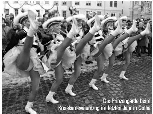
Die Prinzengarde beim Kreiskarnevalumzug im letzten Jahr in Gotha

Geratalstr. 55 • 99094 Erfurt-Bischleben Telefon 03 61/7 96 83 08 • Fax 03 61/7 91 89 17