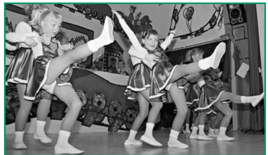
Tanzmäuse des MCC